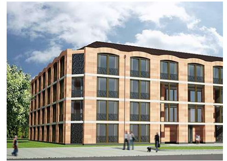
Klinik Ethianum, Heidelberg