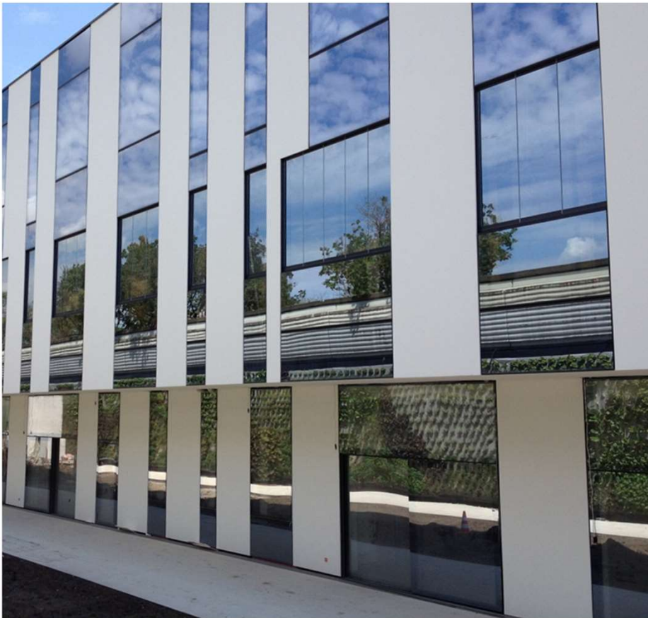
Geriatrizentrum Donaustadt, Wien