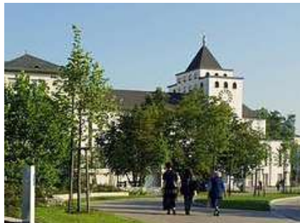
Krankenhaus Barmh. Brüder, Regensburg