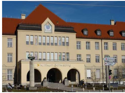
Krankenhaus Schwabing, München