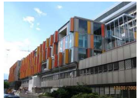
Kinder- und Herzzentrum, Innsbruck