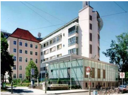
Rotkreuz Krankenhaus, München