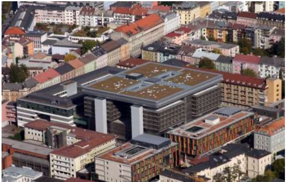
Investitionsprogramm 2015, TILAK, Innsbruck

Unabdingbar für den Gesamterfolg eines Klinikprojekts ist die Einbindung eines Projektsteuerers mit Kenntnissen in Planung und Betrieb von medizinischen Einrichtungen