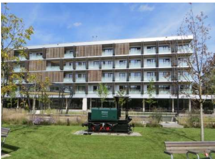
Geriatriezentrum Baumgarten, Wien