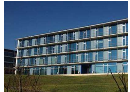
Institut für Agrarwissenschaften, Freising