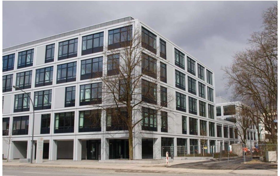
Berufsschule I, Landshut

Zusätzliche Herausforderungen sind der Einzug der elektronischen Datenverarbeitung in praktisch allen Berufen, die Barrierefreiheit und die Inklusion, neue Lernkonzepte, die Ganztagsbetreuung und Anforderungen an Funktion, Gestaltung, Nachhaltigkeit und Wirtschaftlichkeit der Gebäude.