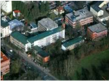
Staatliche Berufsschule I, Landshut