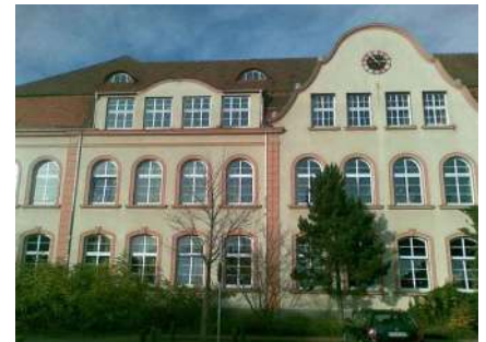
Grundschule Gartenstraße, Roth