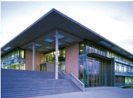
Institut Fakultät Maschinenbau, Illmenau