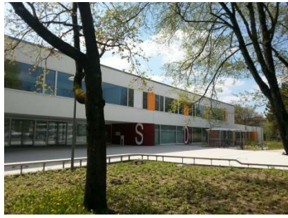
Schwalbangerschule, Neuburg / Donau