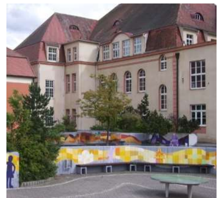
Grundschule Gartenstraße, Roth

Moderne Tools wie eine tagesaktuelle Projektbuchhaltung, Terminplanungssoftware, internetbasierte Datenräume mit automatisierten Workflows, etc. sind ebenso selbstverständlicher Teil unserer täglichen Arbeit wie die Nutzung leistungsfähiger Hardware und Präsentationstechnik und einer Videokonferenzanlage.