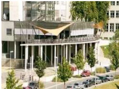
Fachhochschule Jena, Thüringen