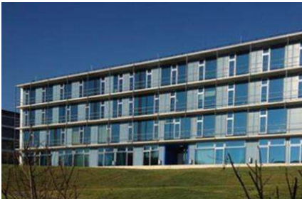
TU Weihenstephan, Forschungsgebäude