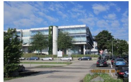
BMW AG, Bürogebäude