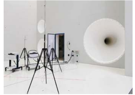
IABG Ottobrunn, Schalltestzelle