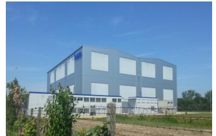
IABG Erding, Flugzeugtesthalle