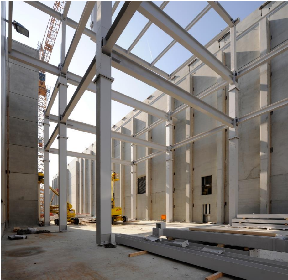
BMW AG, KTL Trockner