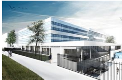
Linde AG, Laborgebäude