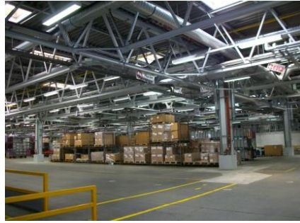
BMW AG, Logistikhalle