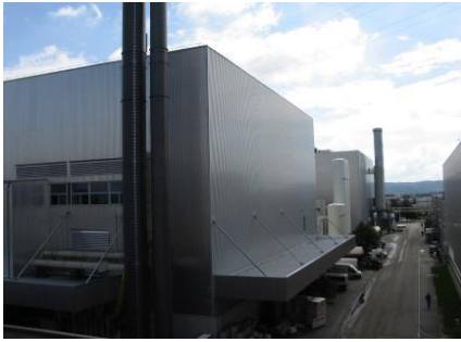
BMW AG, Gießerei Kernmacherei